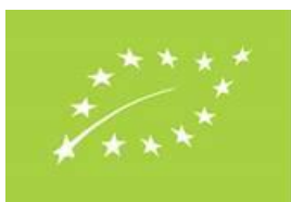
SI-EKO-003 Kmetijstvo Slovenija

Izvajalci, ki so pridobili certifikat za ekološko pridelavo, se lahko sklicujejo na certifikat in uporabljajo certifikacijsko oznako BV na dokumentih, kot so npr. dopisi, promocijski materiali, spletno oglaševanje ipd., pri čemer morajo za odobritev pisno zaprositi BV.